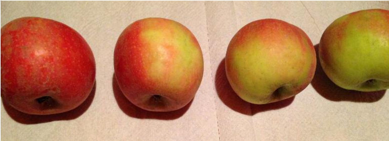
Figura 1. Escala de color. (De izq. a dcha.: del 4 (máx.) al 1 (mín.).)

Las tesis a comparar así como las dosis empleadas y número de aplicaciones se detallan en la tabla 1. Las aplicaciones se realizaron con pulverizador de alta presión (30 bar), y con un gasto medio de caldo equivalente a 2.000 l/ha, que supone a un mojamiento de 2,7 l/planta.